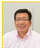
くすのき しげのり （児童文学作家）

絵本『おこだでませんように』（小学館）が2009年度全国青少年読書感想文コンクール課題図書に選出、2011年第2回JBBY賞バリアフリー部門受賞。2013年には『メガネをかけたら』（小学館）が全国青少年読書感想文コンクール課題図書に選出される。