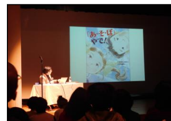
「くすのきしげのり講演会」