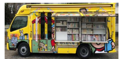
新移動図書館車(わくわく号)