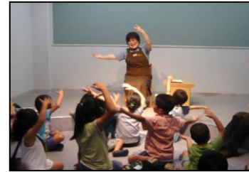
「わくわくおはなし会」