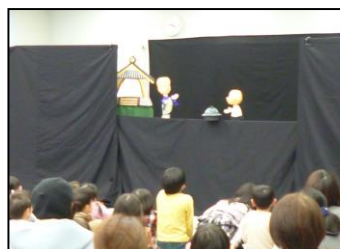
「わくわくおはなしまつり」