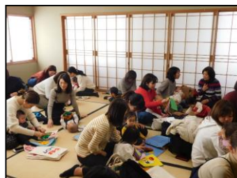
「赤ちゃんと布のえほんであそぼう」