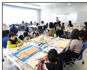
「エコ雑貨をつくろう」