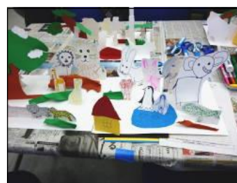
「ぼくの、わたしのどうぶつえんづくり」