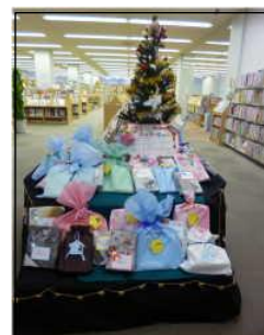
「本のハッピーバッグ」