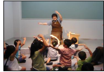
「わくわくおはなし会」