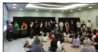
「わくわくおはなしまつり」