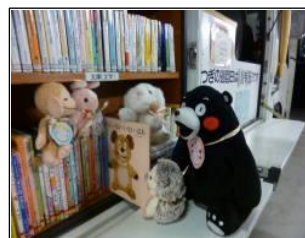
「ぬいぐるみおとまりかい」