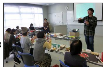
「豆本づくりワークショップ」