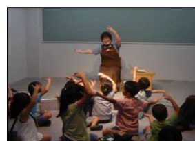
「わくわくおはなし会」