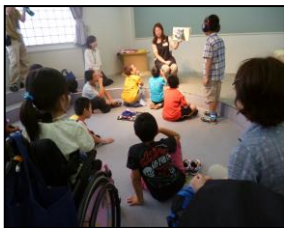
「平野小学校特別学級」