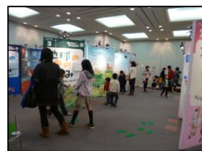
「かこさとし科学展」