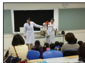
「科学展関連イベント:サイエンスショー」