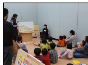
「科学展関連イベント:おはなし会」