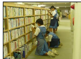
「太宰府中学校体験学習」